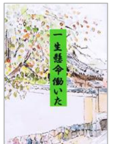
*写真は作品例です