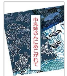
*写真は作品例です