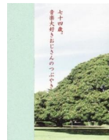
*写真は作品例です

主催：NPO法人シニアわーくすRyoma21 「ききがきすと」専用サイト FAX：03-5537-5281